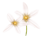
fiori di arancio