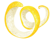
scorza di limone

Marche Igt_Verdicchio, Trebbiano, Malvasia_12.5%_2024_Marche | € 25