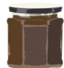
confettura di castagna